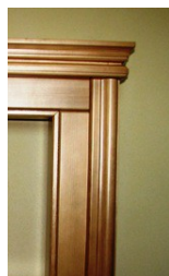
Římsa masive - C