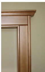
Římsa klasik - B